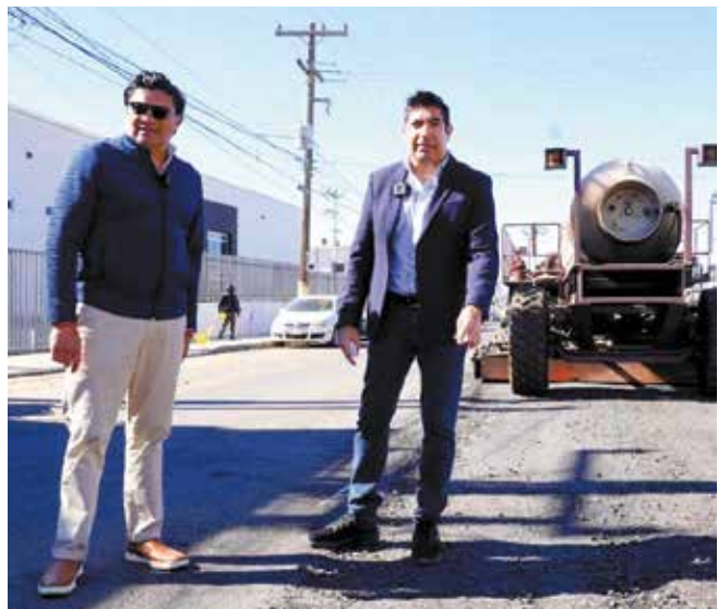
Armando Ayala Robles, ha logrado “enderezar el barco” del municipio de Ensenada

pagan en tiempo; cuando ves que un gobierno tiene paros laborales, es porque hay problemas financieros... Y se preocupa la ciudadanía porque comienzan a fallar los servicios públicos como recolección de basura, ya no están los trabajadores bacheando, no reparan las lámparas, en las oficinas los trabajadores están inconformes y se presta mucho más a cometer actos de corrupción”, precisó.