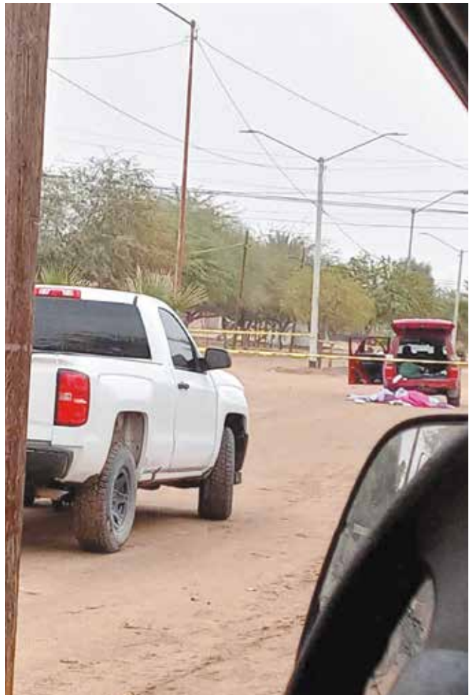
El enfrentamiento con armas de grueso calibre ocurrió en los límites de estación Coahuila.