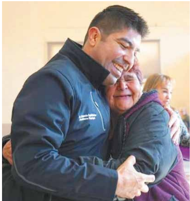
Cuando hay finanzas sanas en un municipio, el futuro es muy prometedor.

“Sí haces una mejor administración, no tienes que endeudarte, no se presta a que haya paros laborales, por demanda de sueldos o prestaciones que no se