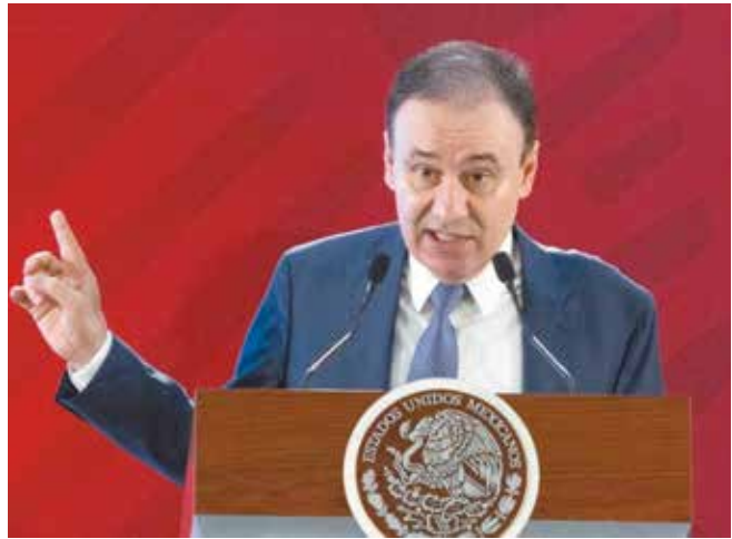
Alfonso Durazo solicitó apoyo al presidente Andrés Manuel López Obrador.

Para habitantes del Km.57 y sus alrededores el clima de inseguridad se ha recrudecido en el último año sin la intervención clara de las autoridades, lo que ha orillado a comerciantes a modificar sus horarios de operación hasta las 5 o 6 de la tarde.