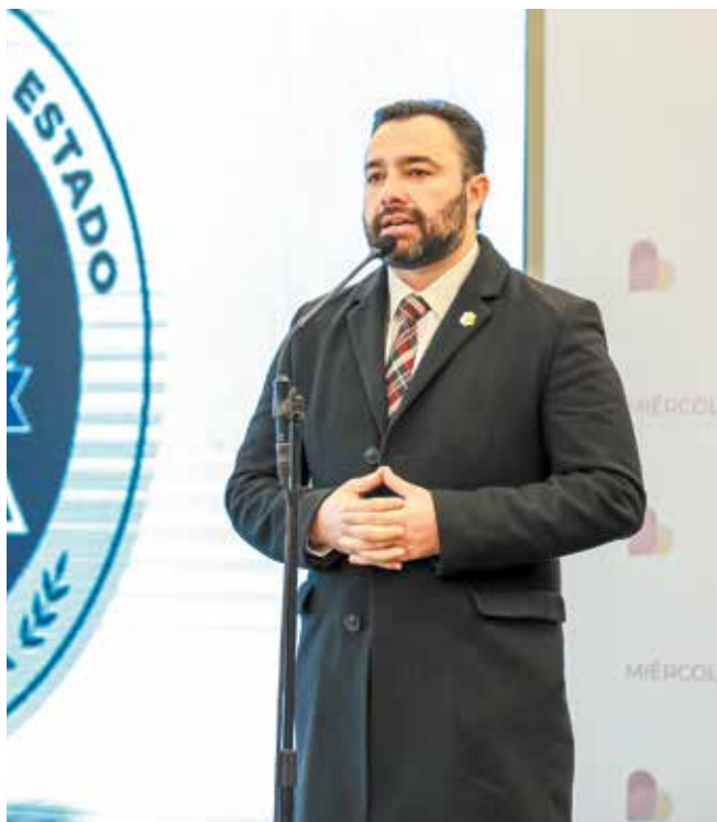
Las investigaciones que ejerce la FGE adolecen de credibilidad, transparencia y efectividad.

Resulta imposible creer que elementos de la Agencia Estatal de Investigación, al mando de Carpio, desconozcan la identidad de quienes lideran las bandas criminales que ordenan día a día entre 6 y