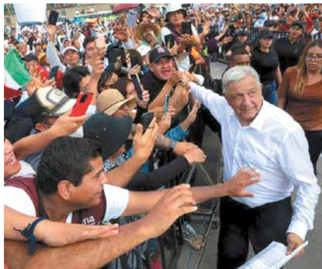
CRÉDITO Gobierno Federal

Se ha dado atención a los pueblos indígenas de México. No se excluye a