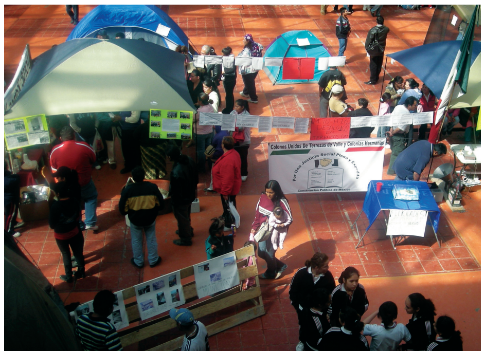
Plantones: Precio político

Mientras el conflicto entre presuntos dueños se desarrolla en el Tribunal Superior Agrario, quienes habitan en Terrazas del Valle sostienen otra disputa contra autoridades municipales y estatales.