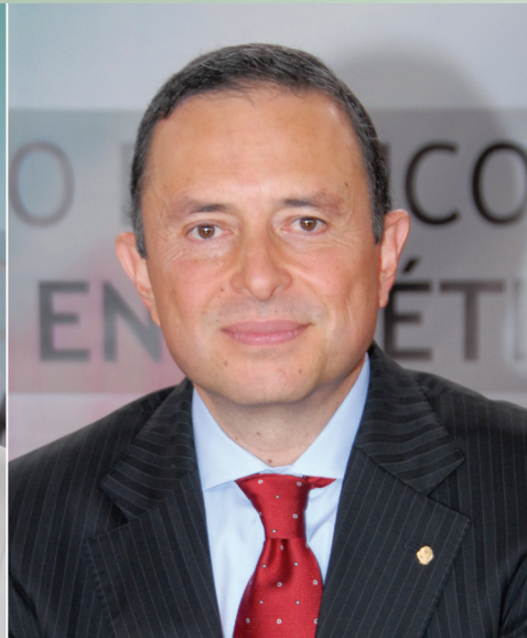
Senador Fernando Castro Trenti PRI