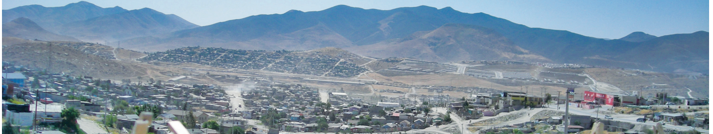
Terrazas: Mil hectáreas en Juego