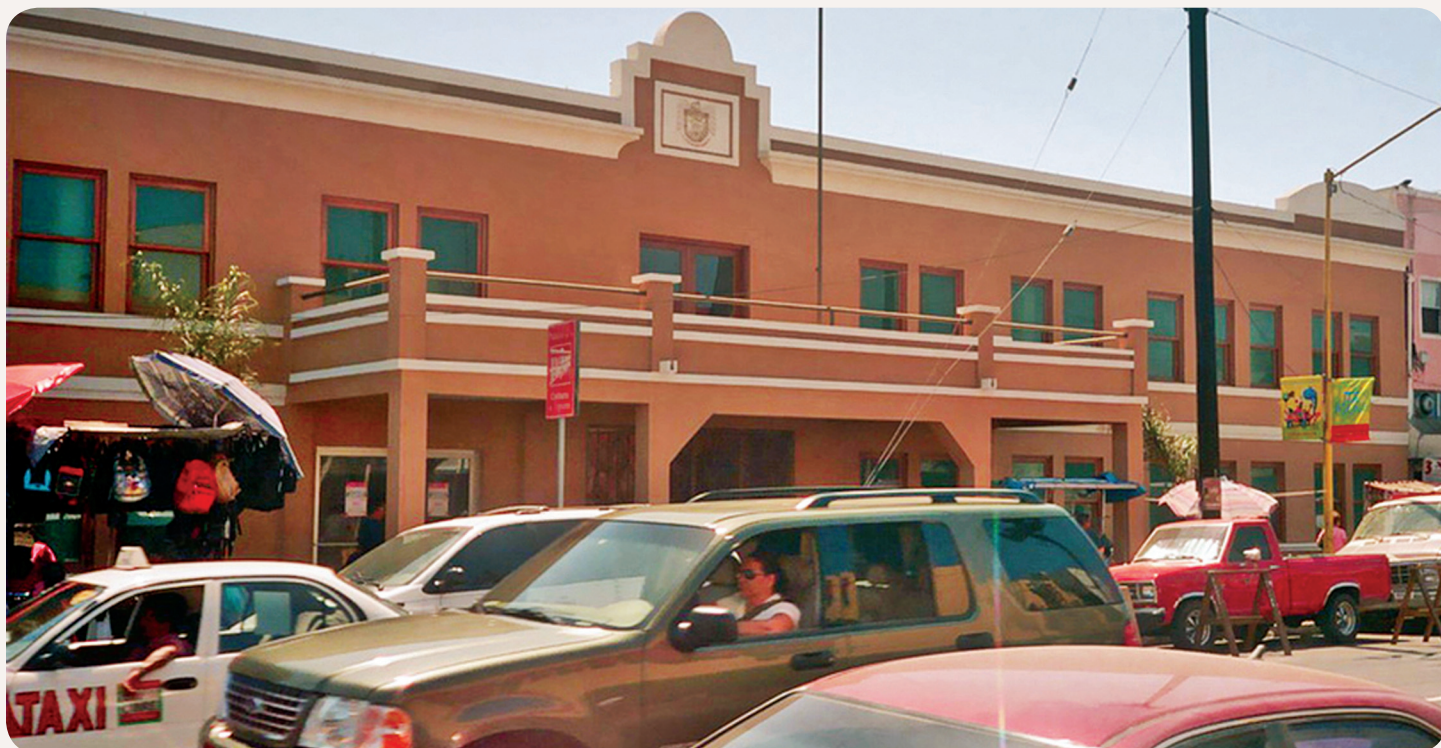
Palacio de la cultura

Podemos señalar que se realizaron algunas obras en donde se pretendió dar una buena imagen hacia el exterior, pero no fue tomada en cuenta la infraestructura existente en el área de la Zona Centro, lo cuál comentaremos en el próximo número con el cual concluimos este artículo, sobre la URGENTE NECESIDAD DE LA REVITALIZACIÓN DEL CENTRO HISTÓRICO DE LA CIUDAD DE TIJUANA.