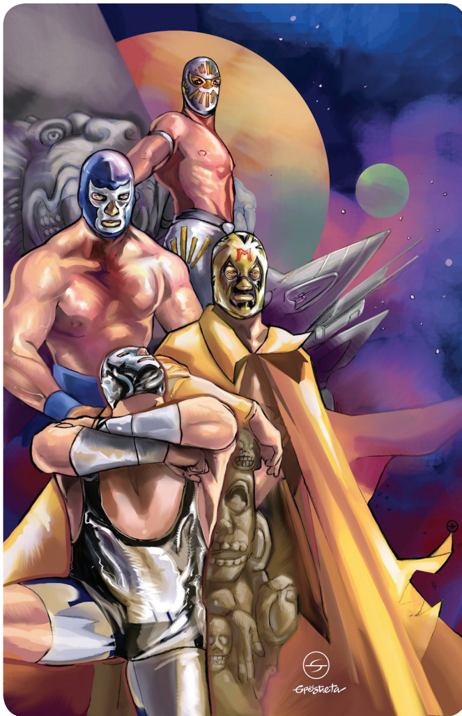
Ilustración de Ulises Grostieta

La lucha libre, con el cine, radio y la televisión, logró penetrar fuerte en el gusto del pueblo mexicano, perfeccio-