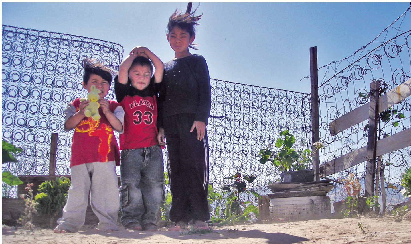
Colonos: Condiciones precarias

En marzo del presente año, los colonos se quejaron ante el Ayuntamiento, de la intervención de la Policía Municipal en la pelea.