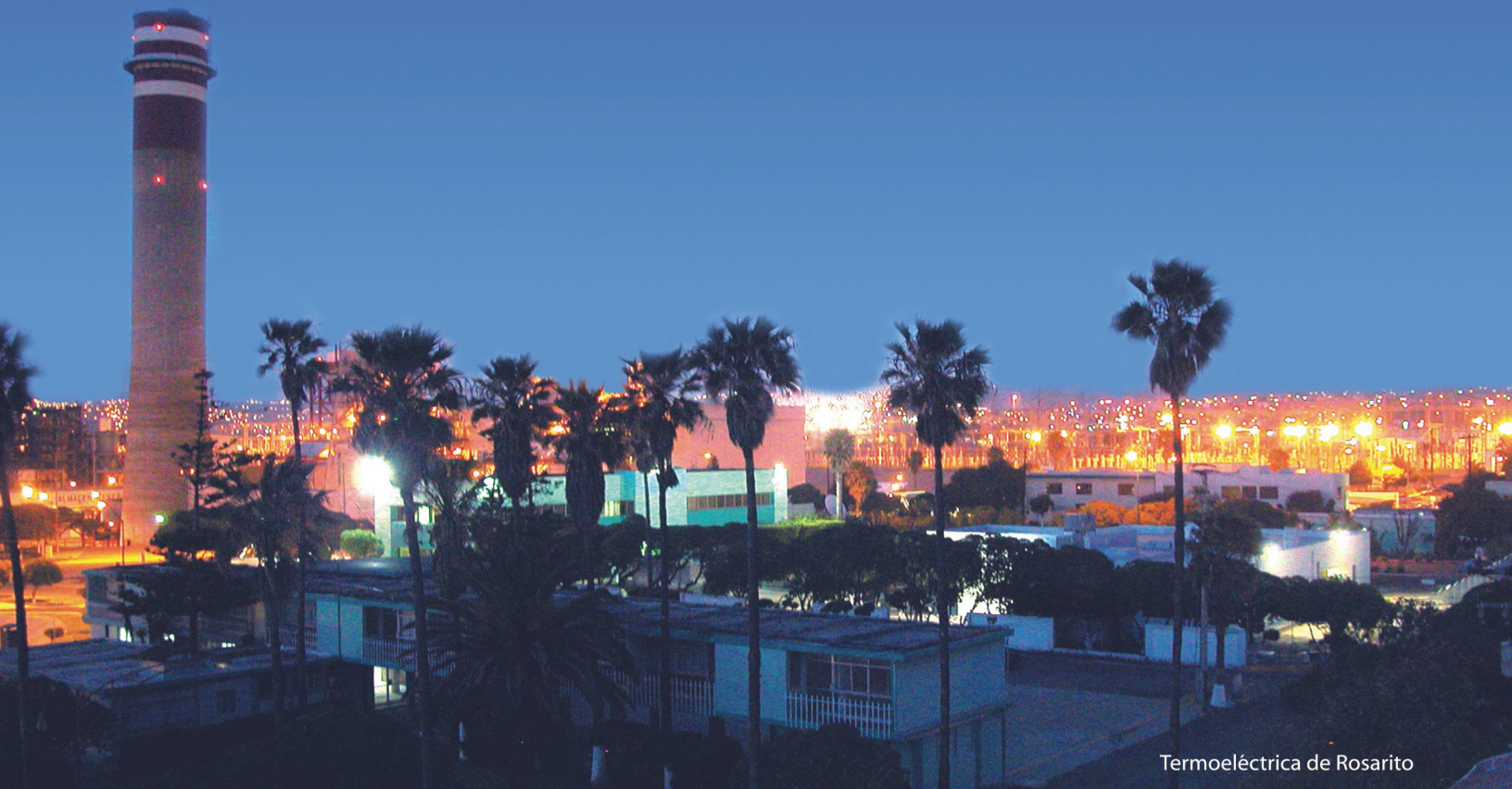
Termoelectrica de Rosarito