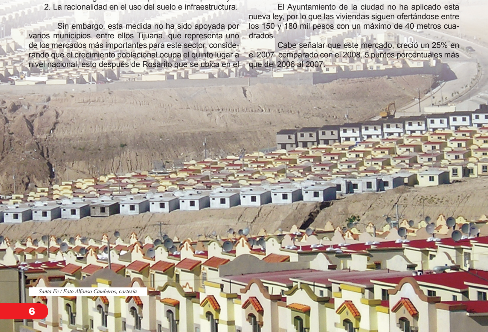
Santa Fe

Cabe señalar que este mercado, creció un 25% en el 2007 comparado con el 2008, 5 puntos porcentuales más que del 2006 al 2007.