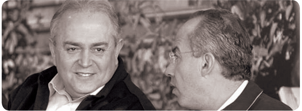
El Gobernador del estado Lic. José Guadalupe Osuna Millán con el presidente Felipe Calderón

Una verdadera muestra del apoyo del Presidente Felipe Calderón hacia el titular del Poder Ejecutivo en el estado Lic. José Guadalupe Osuna Millán lo fue la reunión por vez primera del gabinete de seguridad nacional en la ciudad de Tijuana, donde se dieron cita única y exclusivamente para tratar la es-