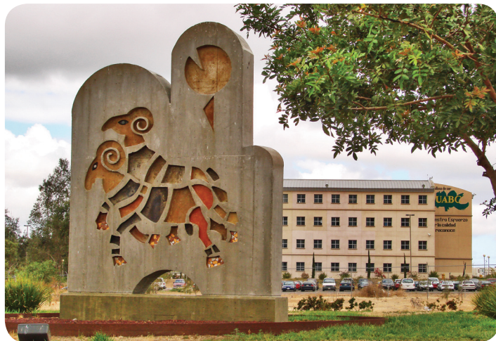
UABC Campus Tijuana

Los falsos redentores del desarrollo económico y ahora, promotores del despojo a la Universidad, pretendieron confundir a la Comunidad Universitaria de que la construcción de ese Centro de Convenciones traería beneficios a la UABC, diciendo que los alumnos de algunas escuelas como Turismo y Administración se verían beneficiados al poder realizar ahí sus practicas profesionales, como si los estudiantes no tuvieran donde hacerlas, cuando lo que realmente querían estos oscuros personajes era su mano de