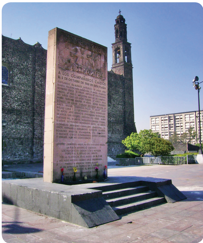
Estela en la Plaza de las Tres Culturas, de la Ciudad de México, escenario de la matanza del 2 de octubre de 1968 con los nombres de algunas víctimas de la agresión.