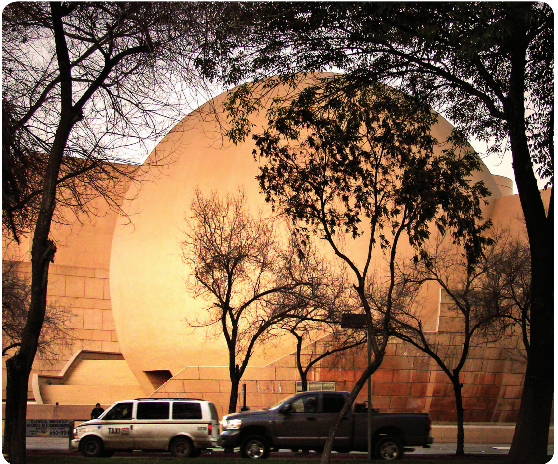
El CECUT

¿Qué viene en esta primera década del XXI? Pareciera que viene la combinación de esfuerzos. Por un lado, la inauguración de la mega obra anunciada por CECUT para este año de la nueva ala, dedicada a las exposiciones internacionales, que podrá albergar muestras que requieran mayor rigor museográfico en todos los sentidos. Por otro, iniciará actividades el Museo del Trompo, para atender al amplísimo público infantil tan deseoso como interesado de participar en actividades culturales desde temprana edad. El ICBC en Tijuana ha ampliado y perfeccionado sus espacios para dar cabida a agendas cada vez más completas. En el viejo Palacio Municipal funciona la Sala Anguiano, sede de un importante acervo donado por el artista jalisciense a nuestra ciudad.