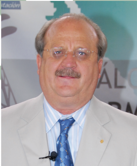
Senador Graco Ramírez Garrido Abreu PRD