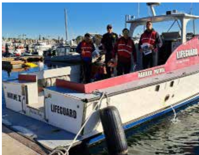
En el simulacro binacional participaron salvavidas de Tijuana y SD.