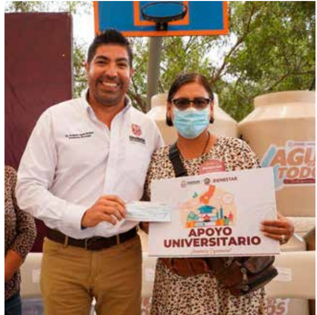
El Presidente Municipal de Ensenada genera acciones de apoyo a la comunidad.

Otro dato interesante, que seguramente también es tomado en cuenta por los ensenadenses, es la vigorosa relación del alcalde Ayala Robles y su equipo de trabajo con el sector empresarial, la llamada iniciativa privada porteña, para dar certeza al empresariado de todos los niveles, pero también atraer más inversiones que se reflejan en la generación de