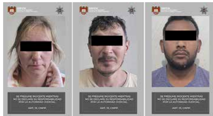
Detuvieron dos ciudadanos rusos y un mexicano en posesión de más de medio millón de dólares.