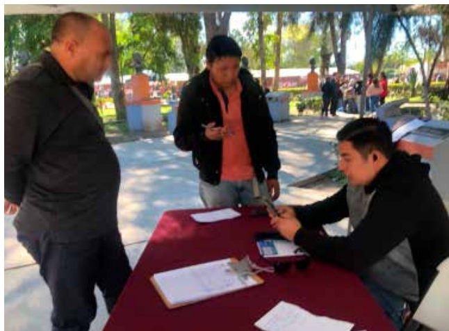
Personal de la DMAM apoya a los migrantes para uso de la aplicación CBP One.

vulnerables, desde la Unidad Deportiva Reforma a la garita El Chaparral, se otorgan a personas de nacionalidad mexicana, cubana, nicaragüense y venezolana, que hayan concretado su cita de solicitud a una excepción al Título 42.