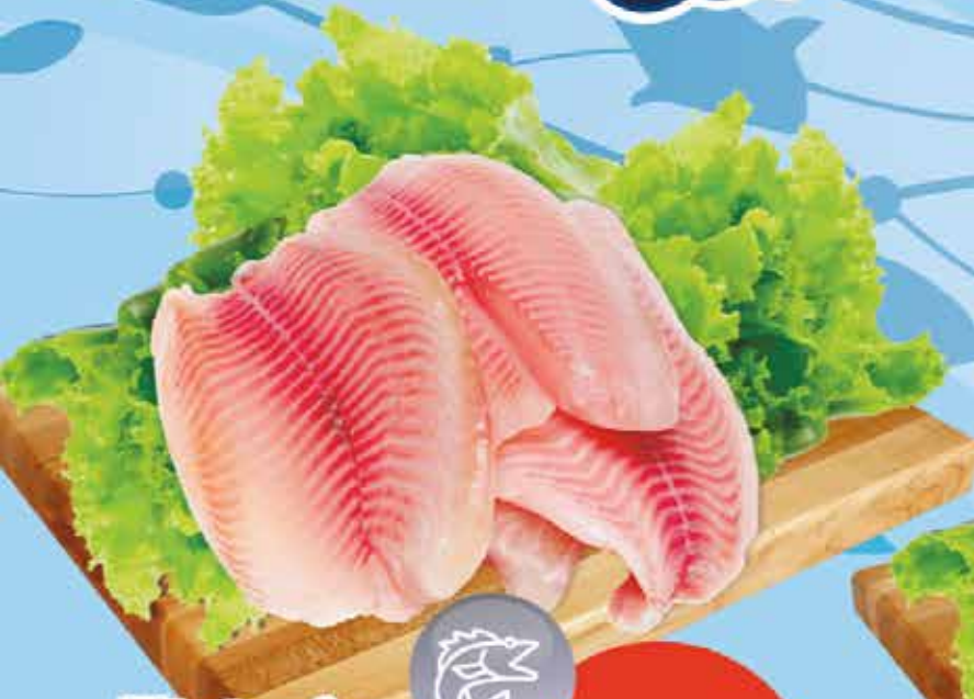
Filete de mojarra