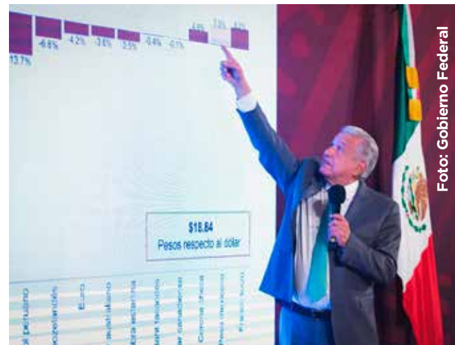
México se posiciona en un mejor panorama en cuanto al crecimiento del Producto Interno Bruto.

El mandatario pronosticó que la inflación baje como resultado de los esfuerzos