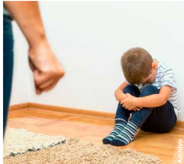
El descuido psico-emocional de un niño pone en riesgo su salud.

Abonando a lo anterior, la Suprema Corte de Justicia de la Nación (SCJN), ha señalado que el abandono de deberes consistente en que el padre o madre, de forma voluntaria deje solo a su hijo; o sin justificación, se aleje de él, descuidando su obligación de proporcionar el crecimiento saludable y armonioso en el ámbito físico como en el psico-emocional, compromete su salud, atendiendo al interés superior de la niñez; es decir, cuando abandonamos o descuidamos el crecimiento psico-emocional de nuestras hijas e hijos, estamos poniendo en riesgo su salud e incurriendo en la causal señalada el artículo antes mencionado.