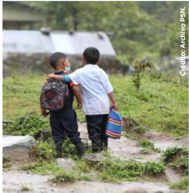
En las zonas rurales los infantes acuden a la escuela aún con lluvia y caminos lodosos.

evitar sentir melancolía con las lluvias en Tijuana, puedo ver que los tiempos han cambiado mucho y a la vez no tanto, porque también aquí se carece de lo mismo.