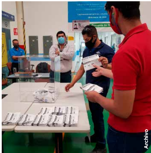
Los trabajadores deberán votar dentro de las instalaciones del centro de trabajo.

El procedimiento de consulta deberá cumplir con los siguientes requisitos: El patrón no podrá intervenir en el procedimiento; la votación se realizará el día, hora y lugar