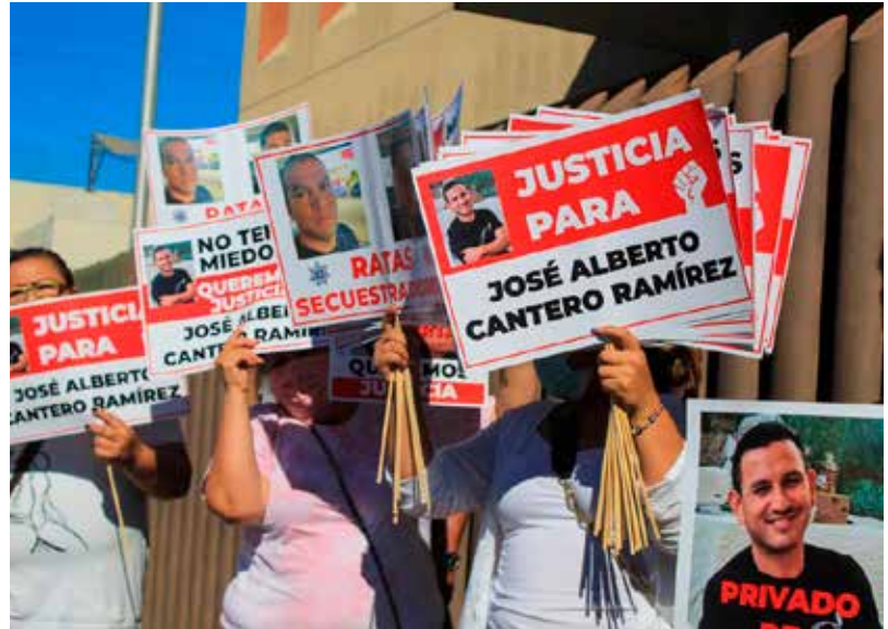
Familiares piden justicia del comerciante.