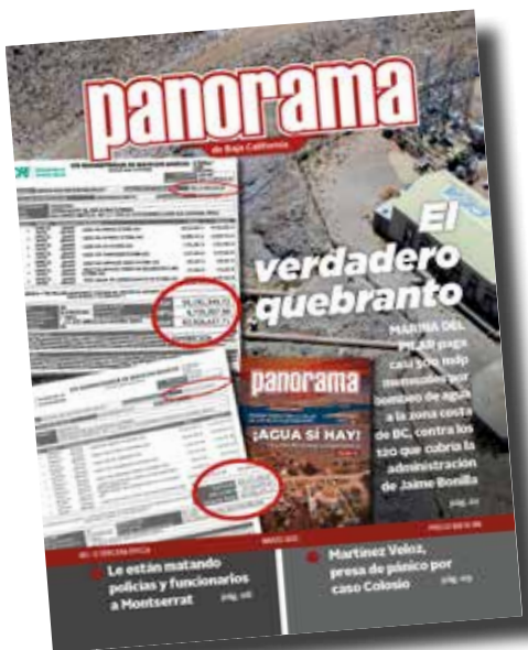
Créditos de portada Ilustración: Cortesía y Omar Martínez.