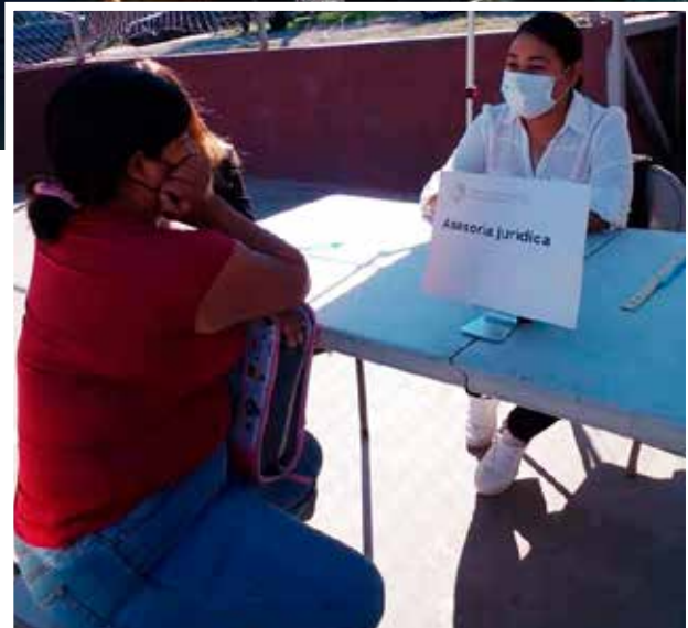
Ofrece asesoría jurídica en temas patrimoniales para la comunidad.

En este momento trabaja en la recuperación