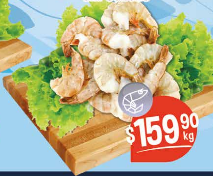
Camarón med. sin cabeza