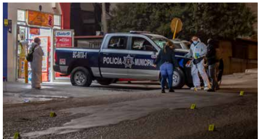
Aumenta el número de agentes policiacos involucrados en actos de ilícitos.