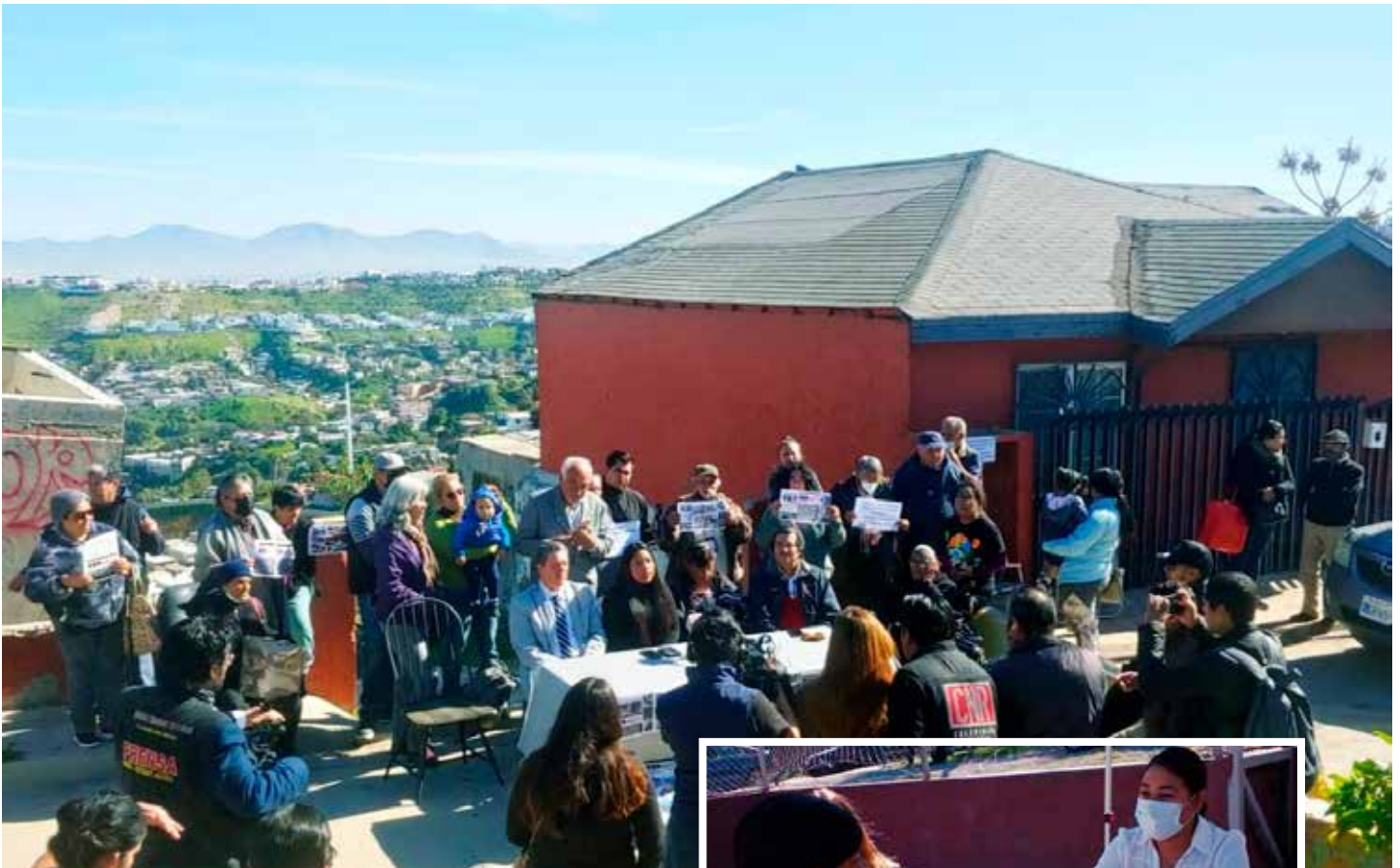
Vecinos de Lomas del Rubí durante años se manifestaron para que las autoridades los atendieran.

deslizamientos de tierra y son afectados, dado que generamos conocimientos y enlaces con colegios de arquitectos e ingenieros y otros especialistas en el tema”, citó.