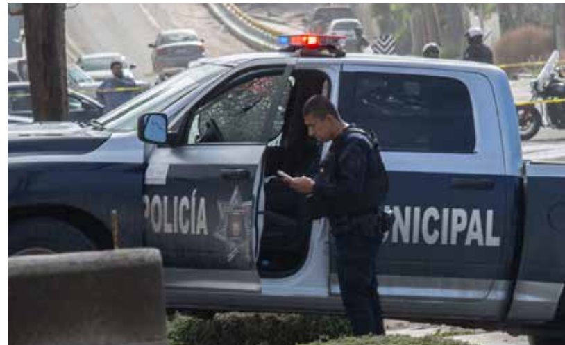
Elementos de la corporación policiaca han sido ejecutados y no por cumplir su deber.