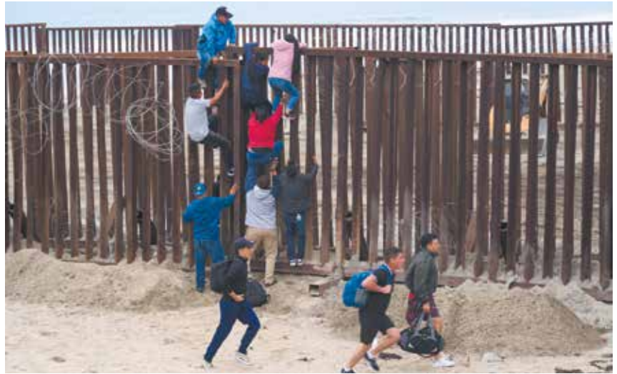
► El muro fronterizo de Tijuana se encuentra abarrotado de migrantes que esperan una oportunidad para cruzar.