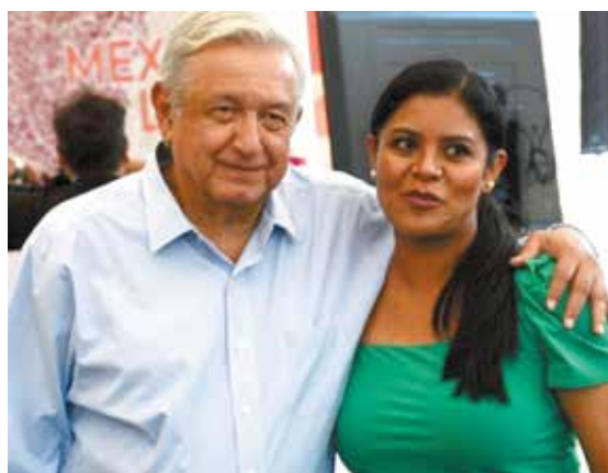
La gobernadora del estado y la alcaldesa de Tijuana quedan mal ante la presidencia de la república solicitando apoyo bajo falsos argumentos.