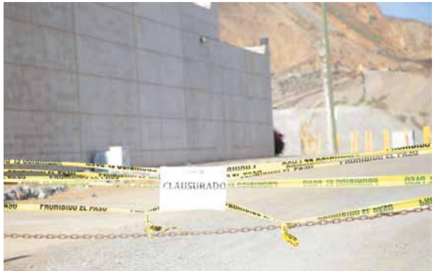
▶ Todavía reclama justicia la comunidad protectora de animales ante tanta aberrante acción.