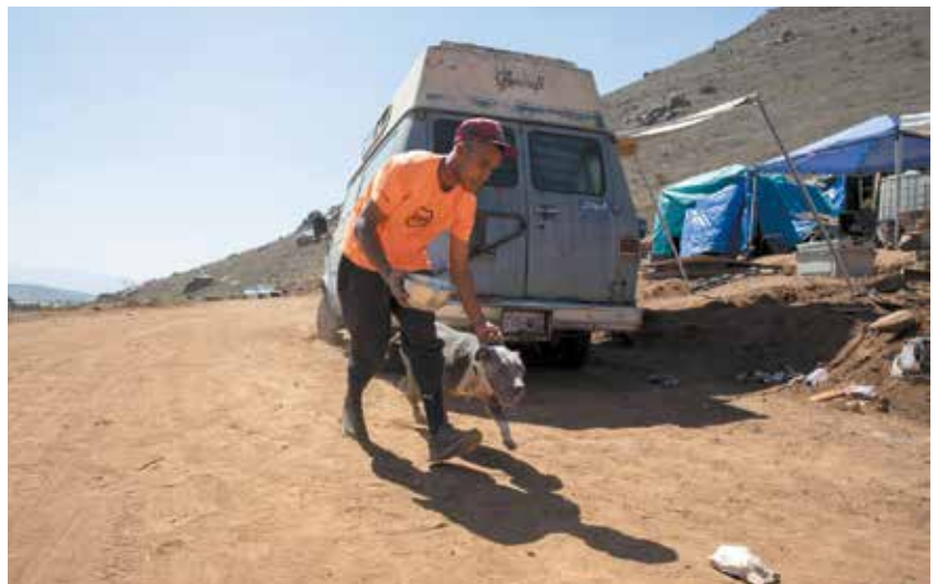
▶ Más de una decena de animales quedaron debajo de los escombros, quienes fueron matados a sangre fría, sin piedad.