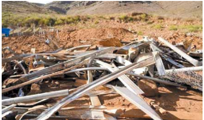
▶ Tractocamiones y retroexcavadoras a cargo de la empresa Amaya Curiel y Pétreos del Pacífico destruyeron el refugio de animales.