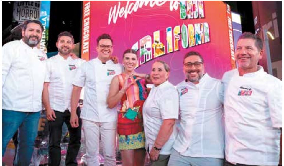
Imagen de la inolvidable gira de la gobernadora de Baja California en Nueva York, Estados Unidos, realizada este verano.

Incluso recuerdan que, del 21 al 31 de julio último, Marina del Pilar también visitó Washington y Nueva York, en Estados Unidos,