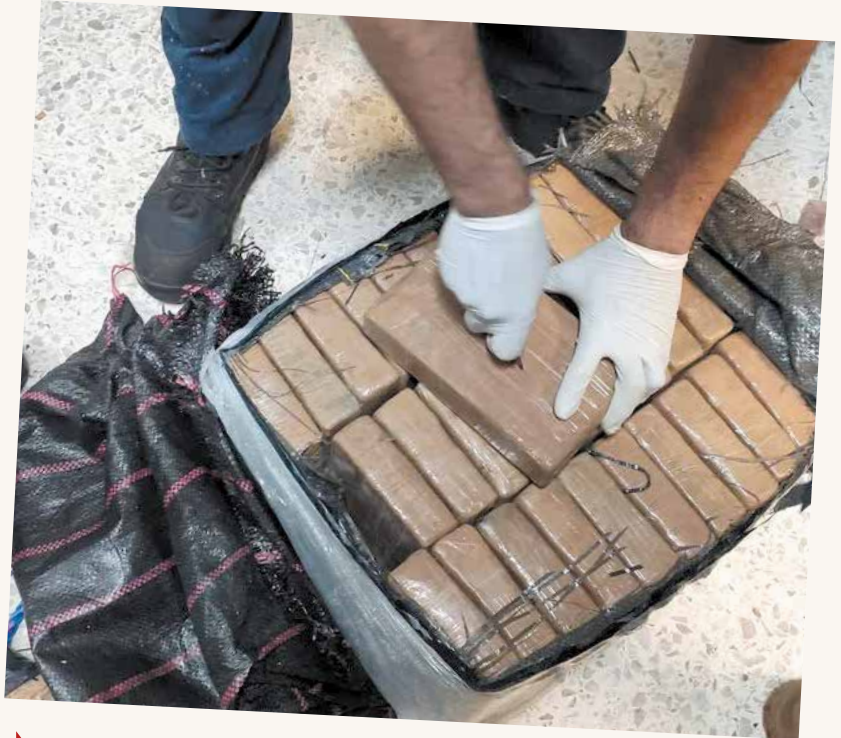
▶ Extraoficialmente se sabe que el policía estatal detenido está cooperando con la DEA y denunció a cuatro de sus compañeros.

Y es que la droga localizada en el domicilio no fue entregada completamente a las autoridades, en este caso a la Fiscalía General de la República,