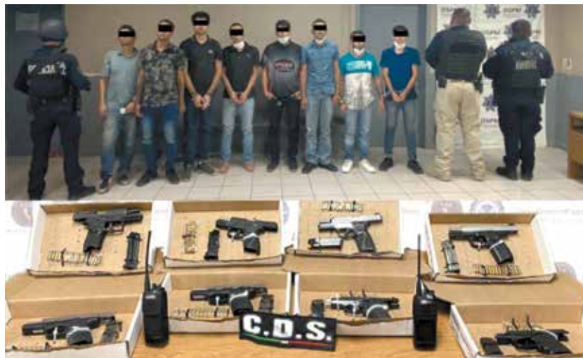
Los cárteles tienen que contratar cada semana decenas de personas debido a las bajas que tienen, ya sean detenidos o muertos.