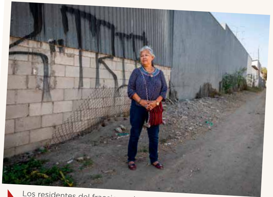
Los residentes del fraccionamiento San Pablo en Tecate dicen estar acostumbrados a los olores químicos, dejándolos a veces con dolores de cabeza.

En marzo, presentamos una solicitud basados en la Ley de Registros Públicos de California para obtener los registros de todos los envíos hacia Temarry desde 2019 (los registros anteriores habían estado disponibles en línea). El departamento aún ni siquiera ha respondido formalmente a la solicitud, algo que según la ley debe hacer en un plazo de 10 días. Han pasado 289 días.