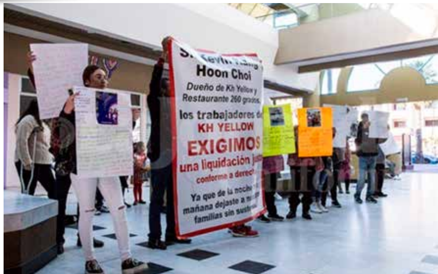
Empresas del estado han abandonado la región por falta de certeza jurídica e infraestructura.