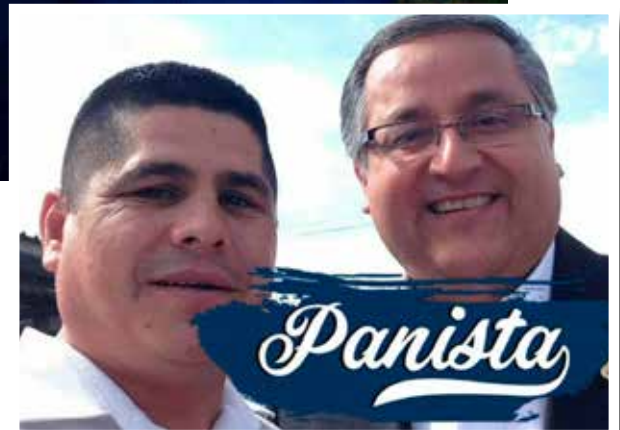
Este pseudo abogado se respaldaba con personajes de la política miembros del Partido Acción Nacional en el Estado.