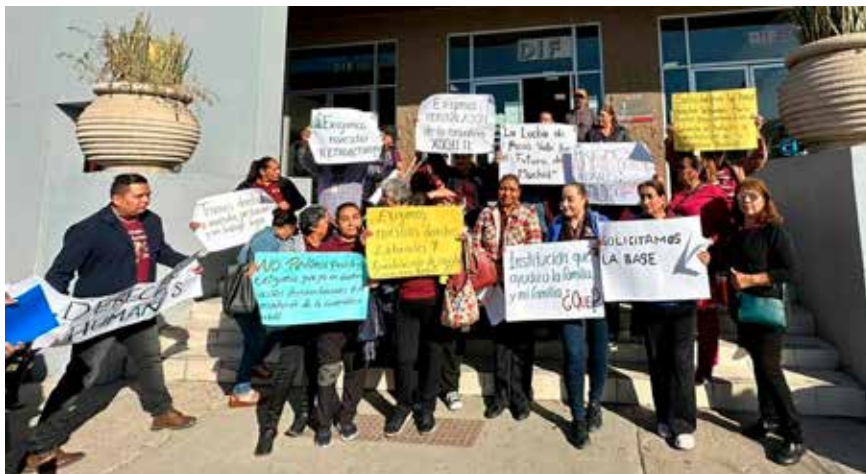
▶ En noviembre ex empleados se manifestaron para reclamar mejores condiciones laborales y reinstalación de personas con varios años de servicio.

Basta revisar el directorio del SDIF, para darse cuenta que áreas operativas claves para brindar atención a la comunidad, están acéfalas, entre éstas: El departamento de Centros de Desarrollo Infantil, encargada de las estancias infantiles y preescolares comunitarios, la Coor-