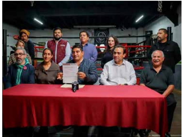
Erik “Terrible” Morales el 4 de diciembre exhibió su constancia de registro para participar en la selección de candidatos de Morena.

El 28 de noviembre (2023), Erik presentó su renuncia ante la mandataria y el 4 de diciembre