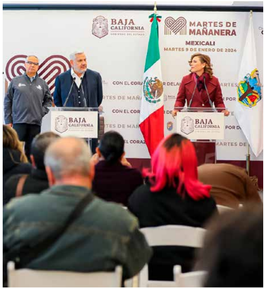
Con bombo y platillo la primera mandataria anunció que representará a México en Davos, Suiza.

En el evento anual en Davos, se discuten temas económicos, políticos y