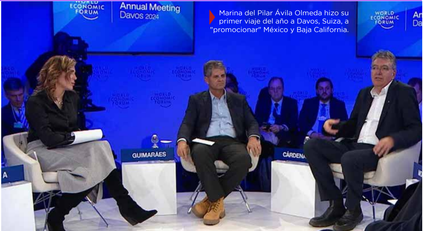
▶ Marina del Pilar Ávila Olmeda hizo su primer viaje del año a Davos, Suiza, a “promocionar” México y Baja California.