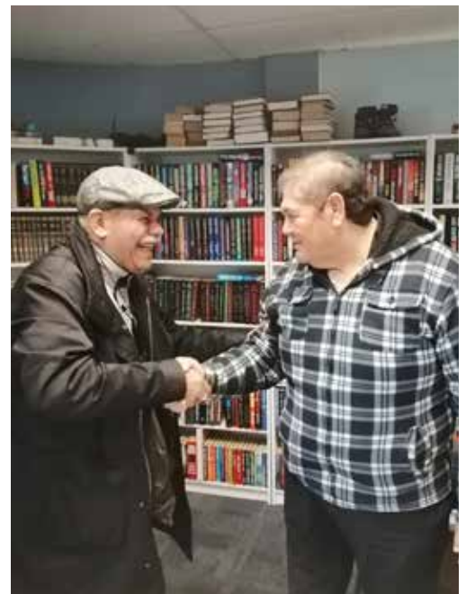
Fue el creador del Archivo Histórico Municipal y recientemente donó su archivo documental.

libre, que fue un éxito ya que se efectuaban visitas a diversos sitios donde aprendieran, convivieran y tuvieran una actividad deportiva.