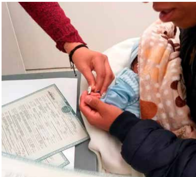
Todos los niños al nacer deben ser registrados para que tengan una identidad.