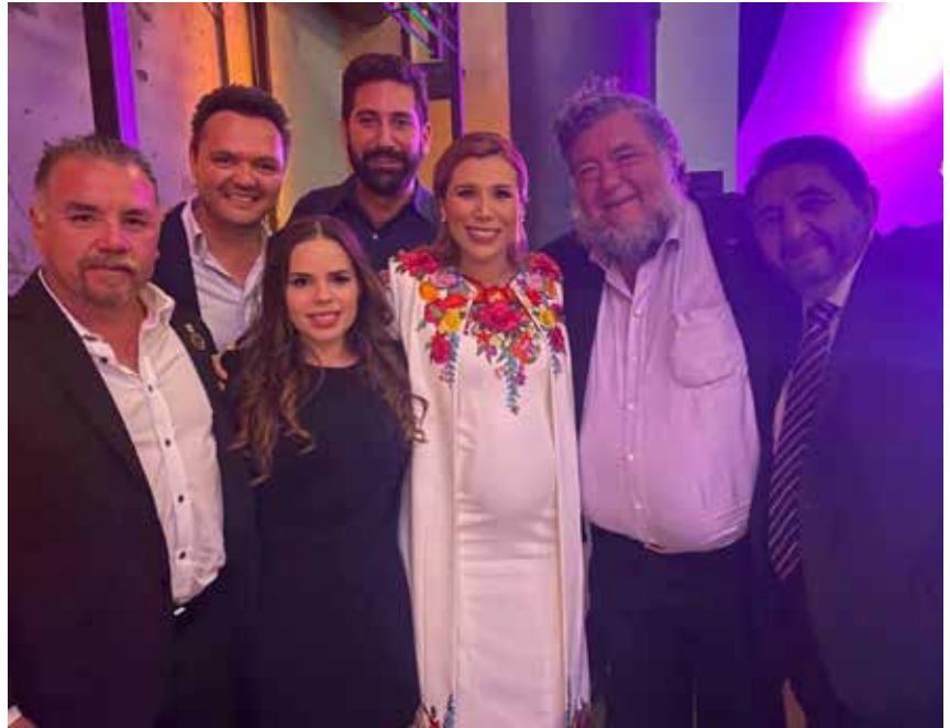
Marina del Pilar Ávila Olmeda desde su toma de protesta evidenció los lazos con la familia Hank.

Al cierre de esta edición, circularon versiones sobre la inminente ruptura de la alianza MORENA-PES, pero el Instituto Estatal Electoral (IEE) no había recibido la documentación respectiva, la cual puede ser presentada con fecha límite del 28 de marzo.