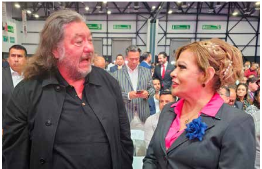
Funcionarios del gobierno del estado entablan relaciones cercanas con el dueño de los Xolos de Tijuana.